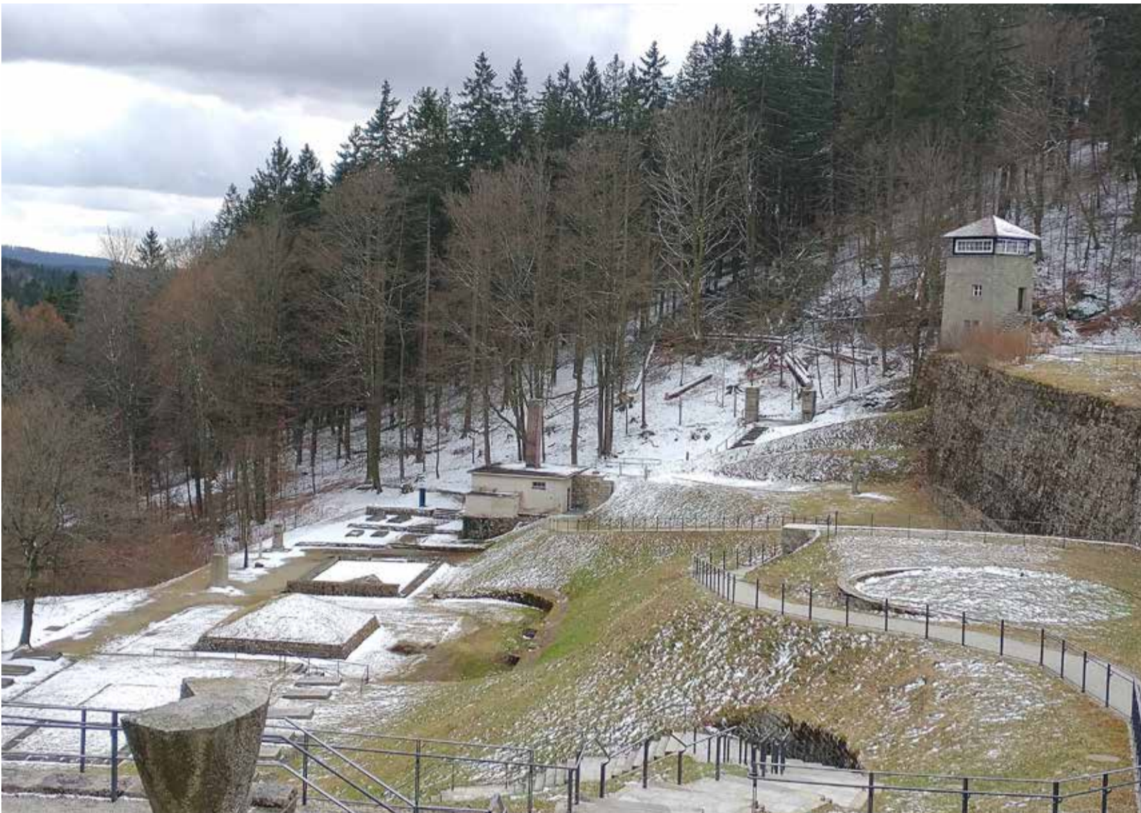
Gedenkstätte Flossenbürg, Februar 2022

die ersten Häftlinge im Lager Flossenbürg ein. Bis zum Ende des Jahres sind es rund 1.500, nahezu alle als „Berufsverbrecher“ in polizeilicher Vorbeugungshaft. Sie arbeiten dort in vier Steinbrüchen. Mein Großonkel ist 162 cm groß und von magerer Statur. Er stirbt am 30. November 1941 um 9:00 Uhr, so behauptet die SS, an einer Herzschwäche.